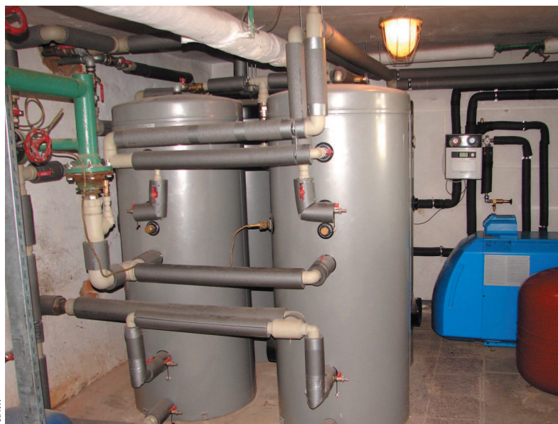
Fot. 1. Widok kotłowni olejowej i zasobników ciepłej wody po modernizacji instalacji